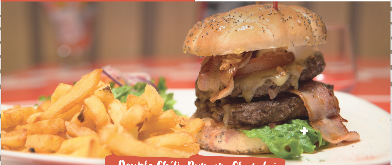
Double Ch'ti Burger Charolais

(steak de charolais 150gr, pain burger, maroilles, tomate, bacon, oignons frits, salade, sauce maroilles)