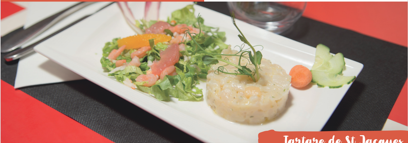
Tartare de St Jacques