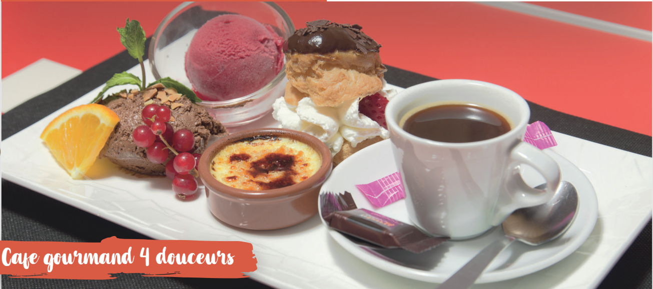
Café gourmand 4 douceurs

*Produit non élaboré sur place mais sélectionné pour ses qualités gustatives / Photo non contractuelle.